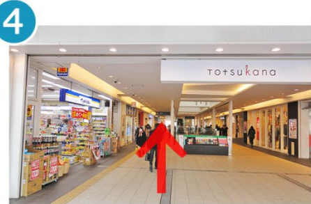
4 トツカーナモールへ入ります。