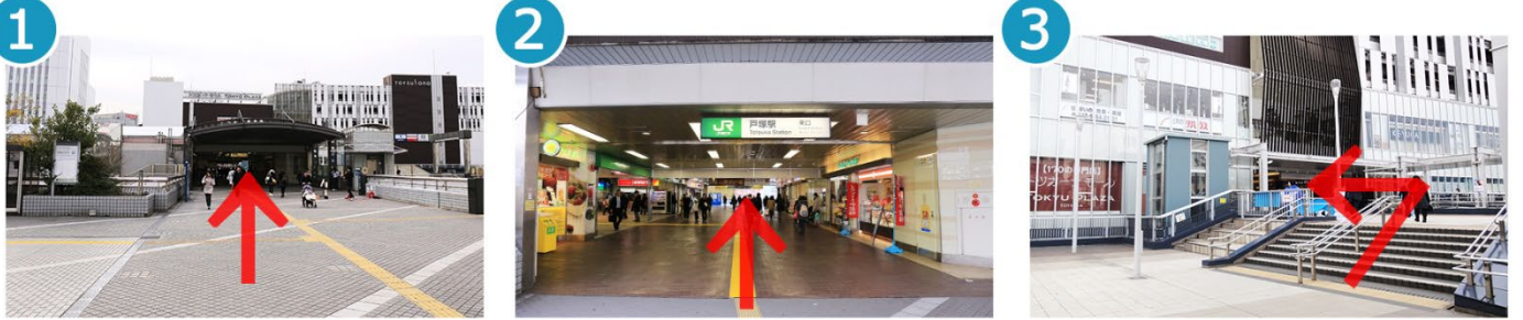
1 戸塚駅方面へ進みます。