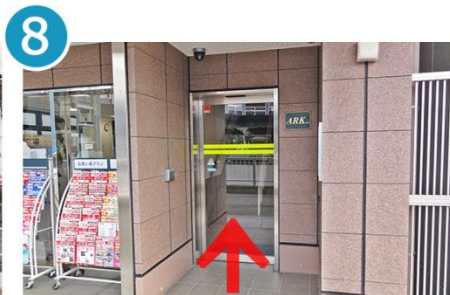
8 ARKビルの入口(2階)に入ります。