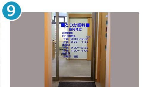
9 エレベーターで3階へ。