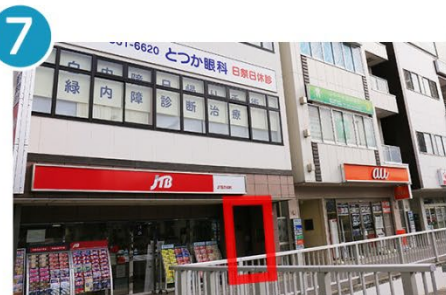
7 JTBの右横に入口があります。