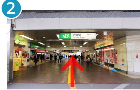
2 戸塚駅の東口からまっすぐ西口へ。