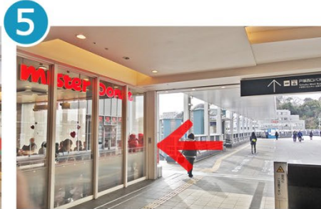
5 ミスタードーナツを左へ。